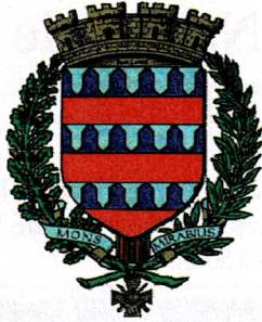
Ville de Montmirail